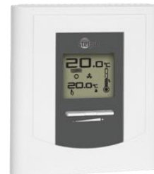
Votre thermostat peut différer de ce modèle.

De façon générale, on peut obtenir des économies d'énergie appréciables en abaissant la température de 2 °C à 3 °C pendant moins de 6 à 8 heures. Il est reconnu dans l'industrie qu'en période de chauffage, la température normale à l'intérieur d'une résidence devrait se situer entre 20 °C et 21 °C . La nuit, on peut réduire la température entre 18 °C et 19 °C .